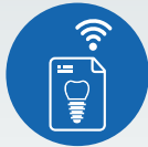
ZI LIVE CASE PRESENTATIONS