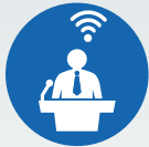
ZI LIVE WEBCASTS