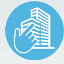
ZIMVIE INSTITUTE PROGRAMS