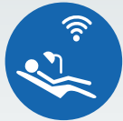
ZI LIVE CLINICAL

Bitte kontaktieren Sie uns für zusätzliche Informationen zu den folgenden Ausbildungsmöglichkeiten: