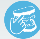
ZI IMPLANT SKILLZ* SERIES